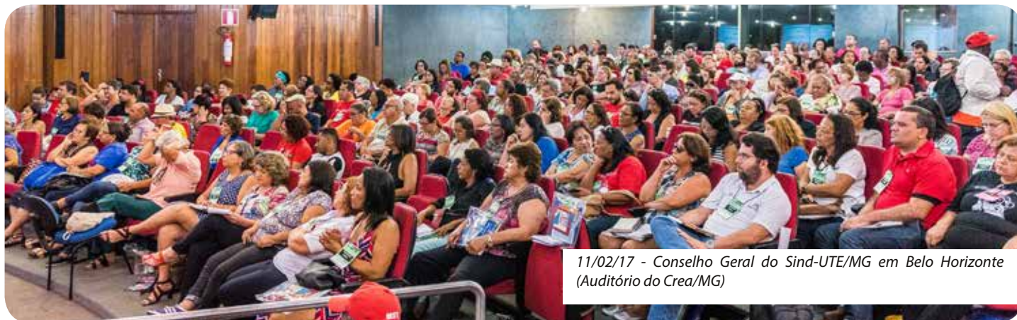
11/02/17 - Conselho Geral do Sind-UTE/MG em Belo Horizonte (Auditório do Crea/MG)

No último dia 31 de Janeiro, o Sind-UTE/MG protocolizou Ofício perante a Secretária de Estado de Educação, onde foram apresentados todos os problemas decorrentes do processo de designação on-line da rede estadual de ensino e, reivindicou que fossem adotadas todas as medidas administrativas no sentido de corrigir a listagem geral de classificação publicada, no dia 30/01/17, com a devida observância dos critérios de prioridade previstos na Resolução SEE 3.205/16.