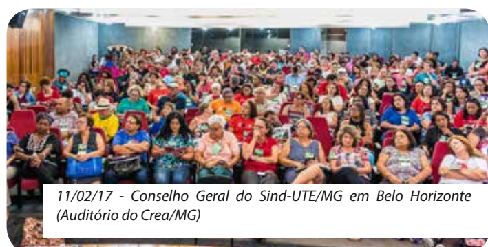
11/02/17 - Conselho Geral do Sind-UTE/MG em Belo Horizonte (Auditório do Crea/MG)

Outro questionamento importante diz respeito ao prazo para interposição de recurso do candidato contra a listagem de classificação. Segundo o Comunicado GS nº 323/2017, expedido pelo Gabinete da SEE, o candidato terá o prazo de 3 (três) dias a contar do dia 06/02/17 para fazer tal questionamento, o que acontecerá no período em que ocorrerão as novas contratações e irá ensejar na dispensa dos candidatos designados.