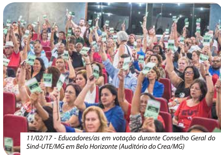
11/02/17 - Educadores/as em votação durante Conselho Geral do Sind-UTE/MG em Belo Horizonte (Auditório do Crea/MG)

Há informações de que são mais de 9 mil recursos num universo de cerca de 28 mil cargos para designação on-line. O sindicato também orientou a apresentação de recurso individual por todos que ficaram prejudicados.