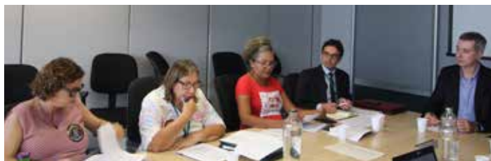
16/1/2020 – Reunião com a SEE/MG para debater a Resolução de designação

No dia 16/1/2020, a direção estadual esteve em reunião com a SEE/MG, e cobrou a publicação da remoção, já atrasada. Na última semana do mês, a categoria foi surpreendida com profissionais alocados em lugares que não correspondiam às cidades residentes, e também de pedidos não consolidados, ainda que existissem vagas nas escolas escolhidas.