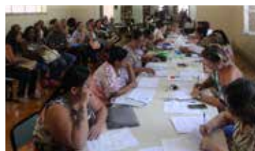
31/1/2020 – Sind-UTE/MG acompanha designação de ASB's no IEMG

Desde o ano passado, a direção estadual se reuniu, por diversas vezes, com a Secretaria de Estado de Educação (SEE/MG) para debater sobre o processo de designação, destacando que a antecipação de todo trâmite garantiria aos profissionais da educação o trabalho e o gozo das férias em janeiro. Estabelecendo uma postura contrária ao diálogo com o Sindicato, desde a publicação da Resolução até o fim da etapa de contratação, a SEE/MG trouxe o caos e encaminhou o processo tardiamente.