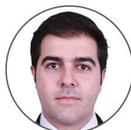
FRANCO CARTAFINA GOMES E-mail: dep.francocartafina@camara.leg.br Telefone: (61) 3215-5283