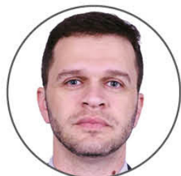
CHARLES THOMACELLI EVANGELISTA E-mail: dep.charlesevangelista@camara.leg.br Telefone: (61) 3215-5517