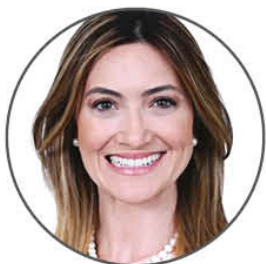
GREYCE DE QUEIROZ ELIAS E-mail: dep.greyceelias@camara.leg.br Telefone: (61) 3215-5340