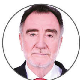
PATRUS ANANIAS DE SOUSA E-mail: dep.patrusanancias@camara.leg.br Telefone: (61) 3215-5720