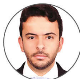
ANTÔNIO PINHEIRO NETO E-mail: dep.pinheirinho@camara.leg.br Telefone: (61) 3215-5584